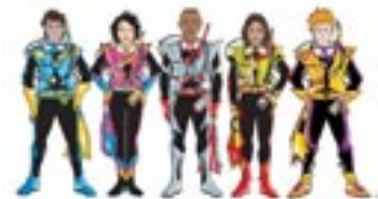
Seal Team Gänget

Nu öppnar vi även upp dykningen för lite yngre entusiaster. Under hösten har PADI utökat sitt kursutbud med dykutbildning för 8-åringar och uppåt. Seal Team utförs helt och hållet i poolmiljö. Barnen får lära sig att hantera dykutrustningen, grundläggande dykteori, säkerhet m.m. Under två inledande dyklektioner. Vi börjar i den grundare delen med att bara andas under vattnet för att sedan avancera med att tömma masken och regulatorn. Efter att ha gjort denna grunddel blir de medlemmar i PADI Seal Team, och kan därefter delta i påföljande Aqua Missions - liknande de dyk som kan ingå i Advanced Open Water kursen. Allt detta sker i poolen och de får här testa t ex "nattdyk" -med belysningen släckt och egna dyklampor, och sök & bärgningsdyk med lyftsäck. Läs mer på www.padisealteam.com